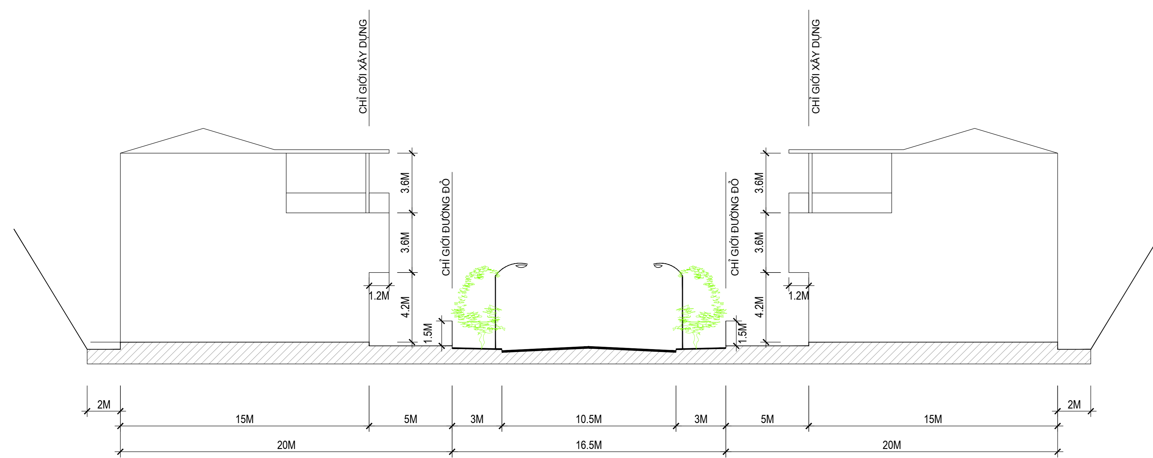
MẶT CẮT NGANG TUYẾN PHỐ ĐIỂN HÌNH