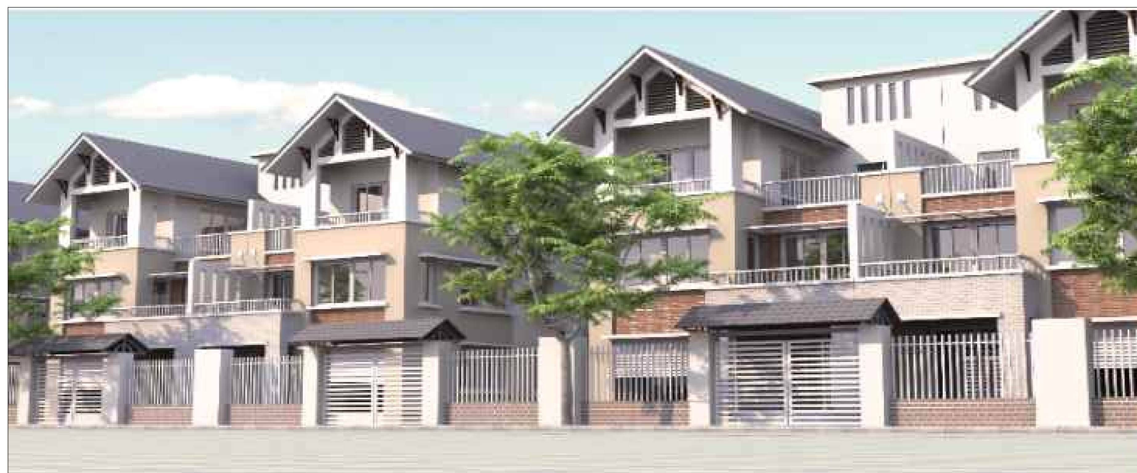
KIẾN TRÚC NHÀ ĐIỂN HÌNH